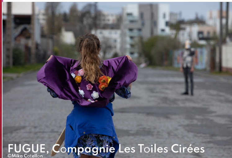
FUGUE, Compagnie Les Toiles Cirées